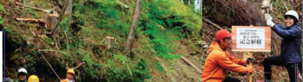
▲飯田市立遠山中学校様より 学校だよりをいただきました。